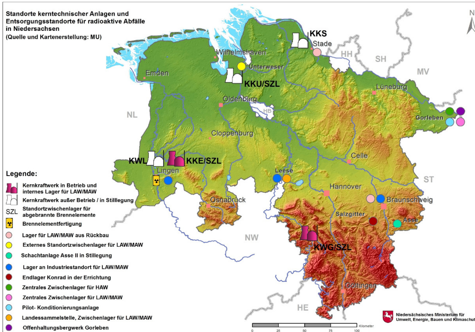
Abbildung 1: Standorte kerntechnischer Anlagen und Entsorgungsstandorte für radioaktive Abfälle in Niedersachsen