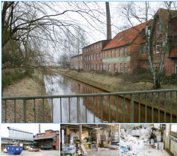
Brachfläche in Nienburg vorher