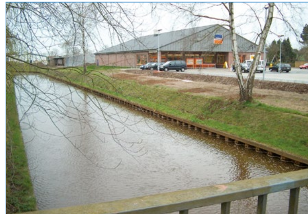
Nutzung der Fläche nachher